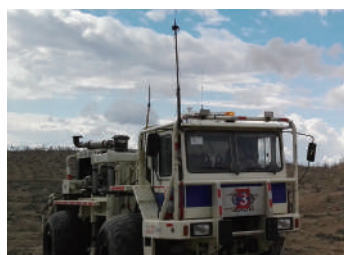
Exploración en exteriores

Se pueden seleccionar varios módulos y accesorios para cumplir con la aplicación de los clientes en diversas industrias.