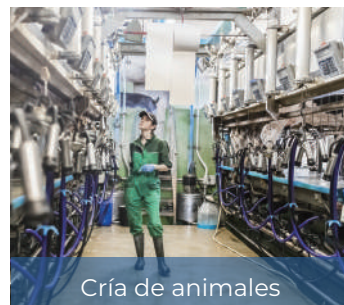
Cría de animales

Contacto: baires@tempelgroup.com www.tempelgroup.com Tel. +54 11 4897 7184/7178