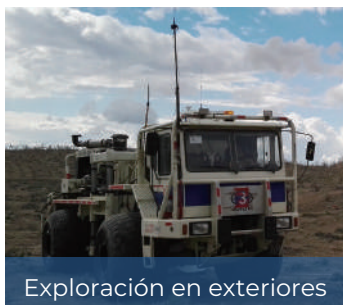
Exploración en exteriores

Se pueden seleccionar varios módulos y accesorios para cumplir con la aplicación de los clientes en diversas industrias.