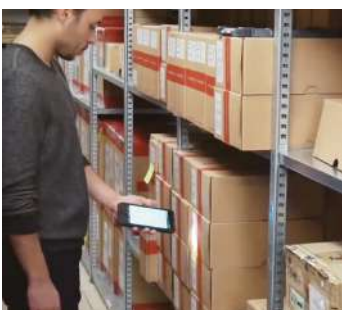
Gestión de almacenes

El terminal de mano con tecnología RFID UHF es ampliamente utilizado, lo que puede cumplir con la aplicación en el comercio minorista, la gestión de materiales de almacenamiento, las finanzas, la entrega urgente, la medicina y otros campos.