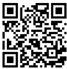
B360 Pro 3D demo